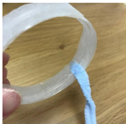
⑦切れ目から3cmくらいあけて 内側から毛糸をまく