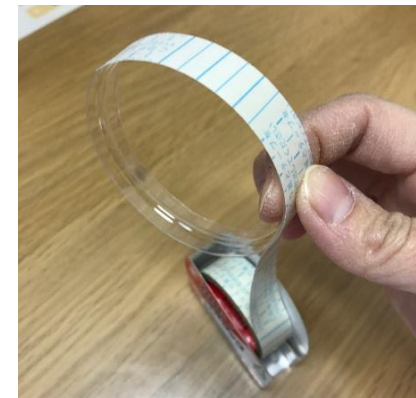
④両面テープをはる 切れ目からスタート