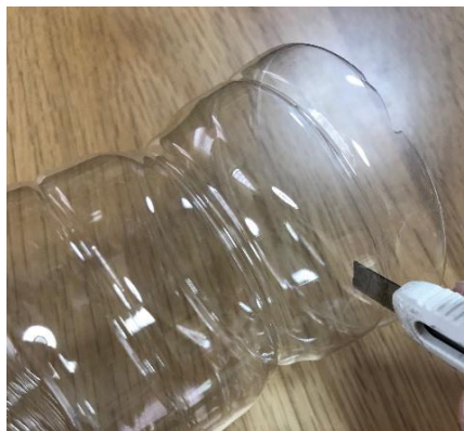
①ペットボトルをブレスレットの幅に切る (1.5cm~2.0cmくらい)