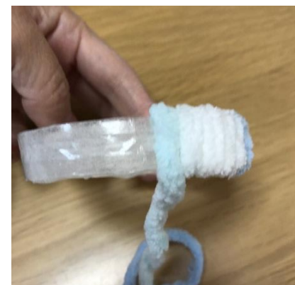
⑧毛糸と毛糸の間があかないように、つめてまいていく